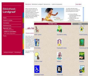
Arbres de recherche à la Bibliothèque publique de Landgraaf