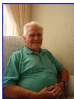
Image (select to enlarge)